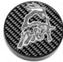
ОТДЕЛКА DIAMOND (КОЛПАК НА СТУПИЦУ)