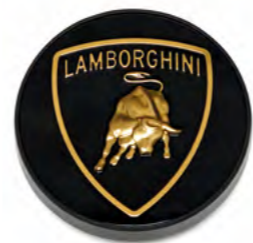
ЗОЛОТОЙ ЩИТОК (КОЛПАК НА СТУПИЦУ)