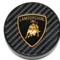
КАРБОН (КОЛПАК НА СТУПИЦУ)