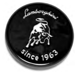
SINCE 1963 («С 1963 ГОДА») (КОЛПАК НА СТУПИЦУ)